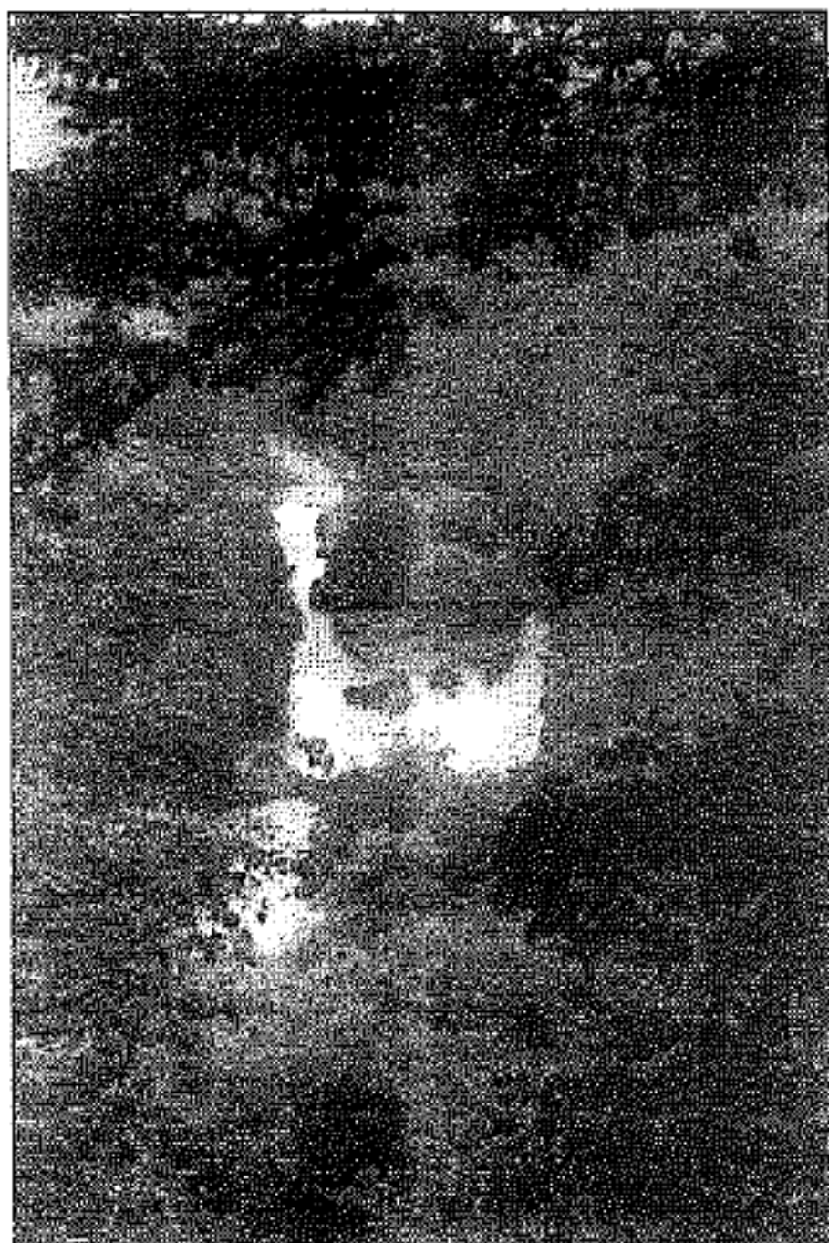
L'Ourthe et le gué

beaux méandres rocheux du Hérou étaient déjà classés comme site naturel. Cette protection descend maintenant jusqu'au Cheslé et se prolonge loin en aval; partout elle s'élève jusqu'aux crêtes des deux rives. En superficie, c'est le deuxième site protégé de Wallonie, le premier étant formé par les 550 hectares du champ de bataille de Waterloo.