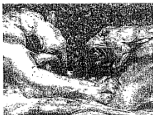
Tigres se disputant une proie (détail).