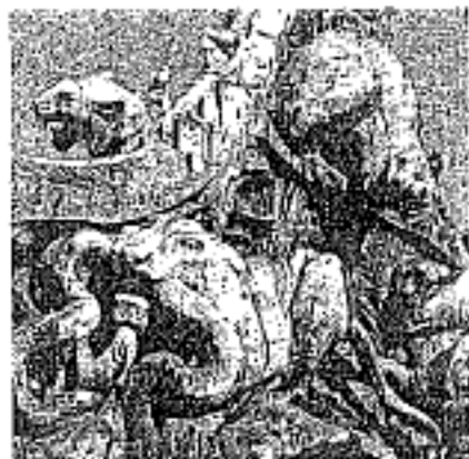
Le Mât-tigre ou Mât électrique (détails).