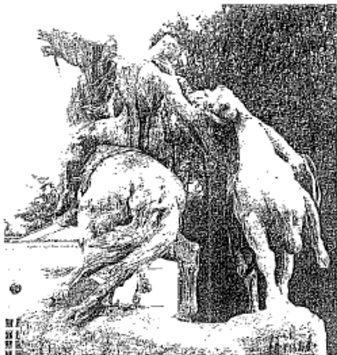
La lutte équestre.